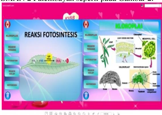
Gambar 2. Cuplikan Media Pembelajaran Rancangan Guru di SMAN 2 Palembang

Setelah dibekali ilmu mengenai aplikasi KFM, guru-guru di SMAN 2 Palembang melakukan praktek terbimbing pembuatan media pembelajaran sesuai dengan mata pelajaran yang diampu. Media pembelajaran berbasis aplikasi KFM tidak hanya bersumber dari bahan ajar, tetapi juga media presentasi atau kumpulan gambar dan video. Cuplikan media pembelajaran yang telah diselesaikan oleh guru-guru di SMAN 2 Palembang seperti pada Gambar 2.